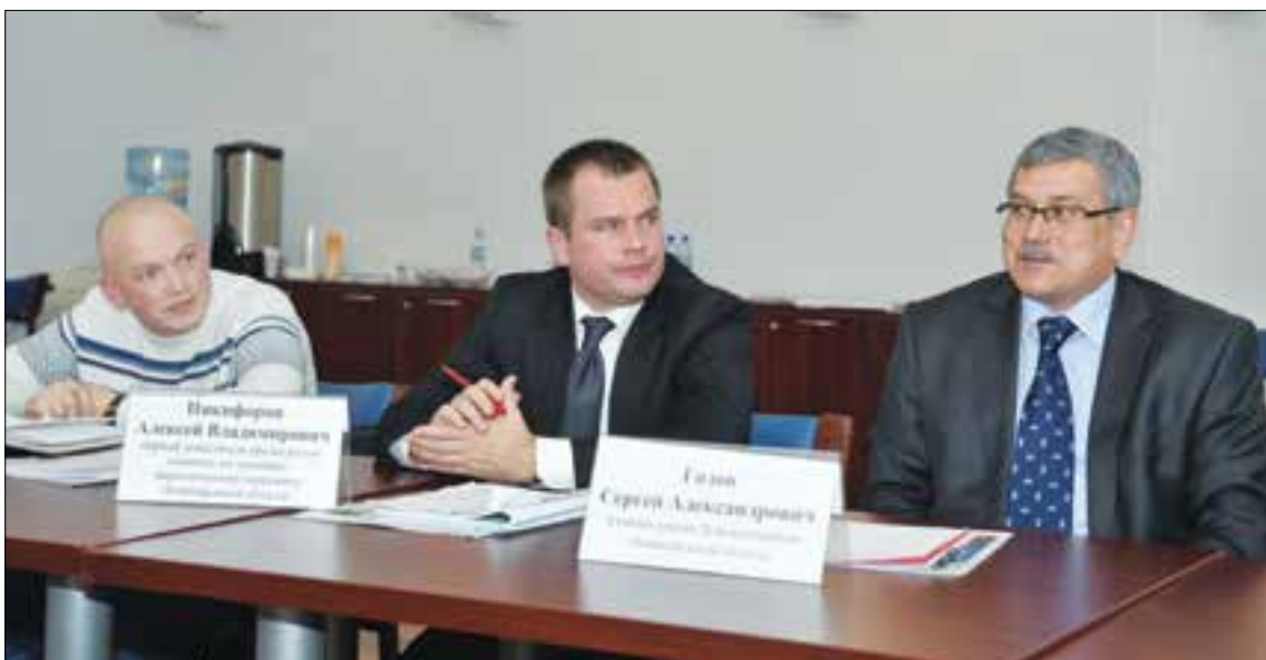
В планах-2015 областного правительства — перевод общественного и коммунального транспорта муниципалитетов на метан

Качественно и своевременно организованная система подачи природного газа — стеновой хребет экономики любого региона. Сегодня Ленинградская область газифицирована на 59%. Реализуемая совместно с ОАО «Газпром» программа с ежегодными инвестициями около 3 млрд рублей увеличивает этот показатель лишь на 2% в год.