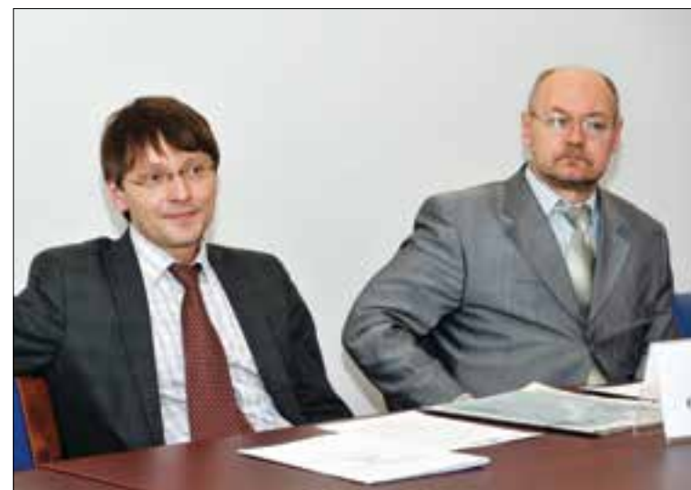
В условиях, когда бюджетные контакты стали безавансовыми, многим подрядным организациям не обойтись без дополнительных заимствований или безотзывных банковских гарантий

Плюс ко всему пять котельных в крупных поселках переведут на сетевой газ. А это значит, что в населенных пунктах не будут отключать газ на 3–4 месяца в летний период, а также улучшится экология. «Лужский абразивный завод расположен в самом центре Луги, и это плохо вли-