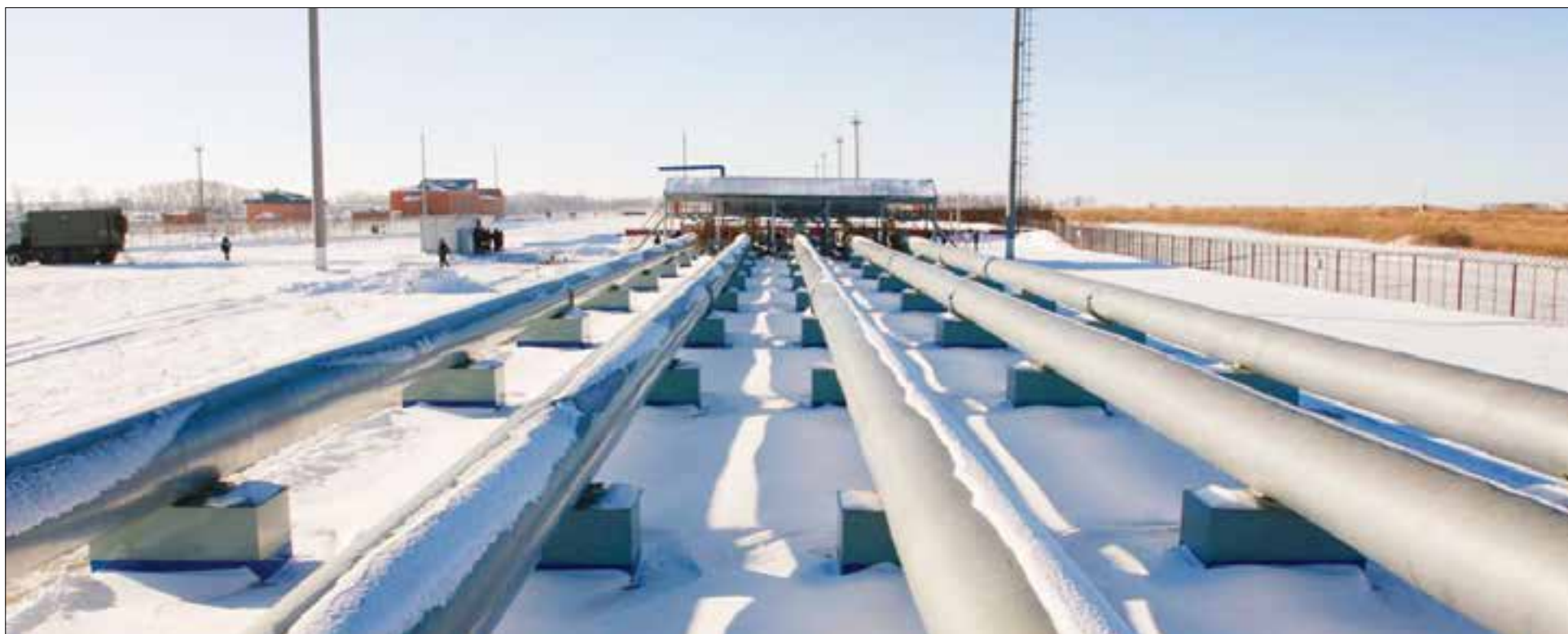
Программа газификации 2015 года будет продлена, сейчас комитет по топливно-энергетическому комплексу формирует программу 2016–2020 годов