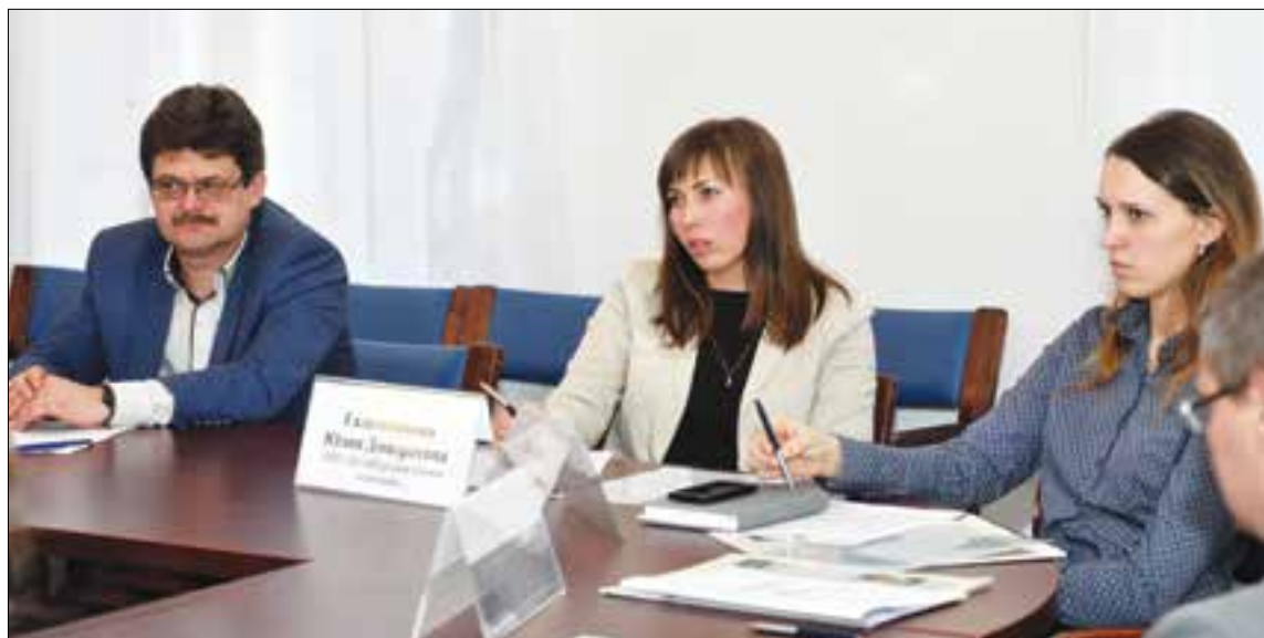
Начало 2015 года в области ознаменовалось ажиотажным спросом на газификацию со стороны физлиц

Преимущества газифицированных участков и недвижимости по отношению к негазифицированным колоссальные. «Сейчас по области в зависимости от района сотка земли стоит от 55 до 70 тыс.